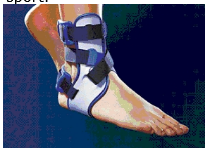
Fig.5 Attelle de cheville http://www.sanomed.cz/cz/katalog/kotnik/item-0006919

Pansements et orthèses sont également utilisés pour leur effet thermique et positif sur l'afflux sanguin dans la région du pansement, leur effet anti-oedèmes et propice à la myorelaxation, les changements biomécaniques et la stimulation de la proprioception. Comme les pansements et attelles soutiennent ou modifient la fonction de la région anatomique traitée, il appartient au médecin traitant de bien connaître les caractéristiques et modes d'utilisation des différents modèles. Chaque accessoire doit être choisi au cas par cas en fonction des besoins spécifiques du sportif, du type de blessure et, enfin, du type de sport.