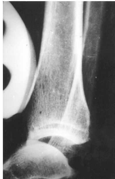
Fig.2 X-Cliché dynamique montrant un tiroir antérieur