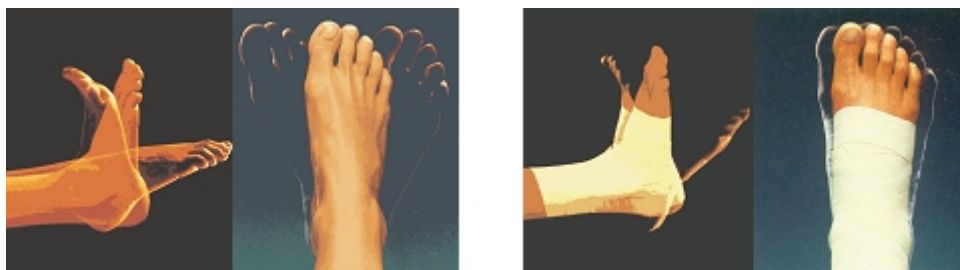
Fig.4 Les effets du taping

La pose d'un taping a pour but d'accroître la mobilité dans des conditions de stabilité contrôlée.