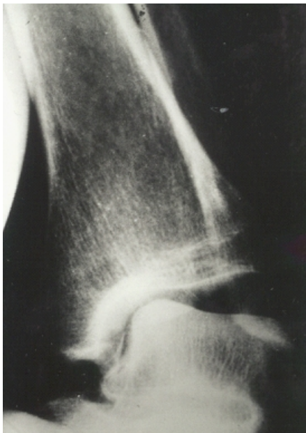
Fig.1 Cliché dynamique montrant une stabilité latérale forcée

Des clichés avec incidences standards de la cheville sont nécessaires pour exclure toute blessure osseuse. Si les distensions et insuffisances ligamentaires ne sont pas visibles, elles peuvent néanmoins être détectées par manipulations (forcées, appuyées). Un CT-scan et une IRM peuvent aider dans certaines situations bien précises.