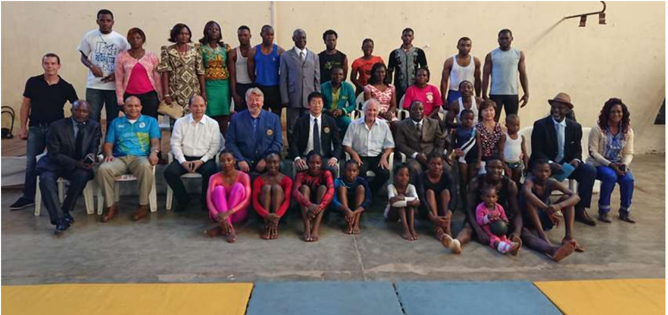
Le Bureau Présidentiel a rencontré des gymnastes à Yaoundé, au Cameroun, s'entraînant sur des tapis de judo.

Certaines fédérations ayant des membres au CE pourraient devoir ainsi assumer des frais de voyage supplémentaires, tandis que d'autres fédérations pourraient avoir des frais moindres. J'aimerais que les fédérations concernées fassent preuve de coopération et de compréhension et je les en remercie par avance.