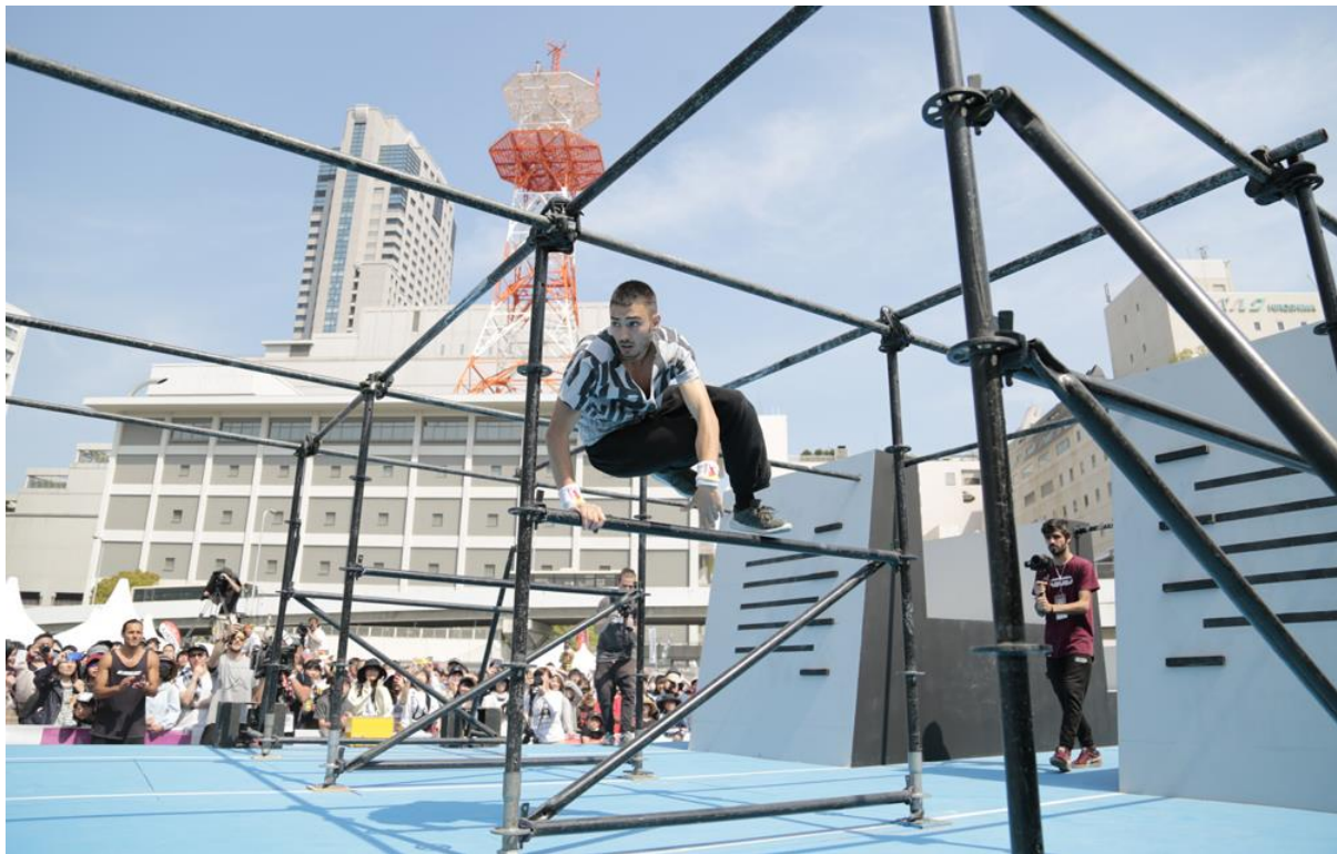
Coupe du monde de Parkour à Hiroshima, au Japon

Les Coupes du monde de Parkour se sont tenues avec succès à Chengdu, en Chine, puis à Hiroshima, au Japon, dans le cadre du FISE, le festival des sports urbains qui a attiré 103.000 sur trois jours. Quelque 600.000 visiteurs sont attendus pour le prochain FISE à Montpellier, en France, où aura lieu la troisième Coupe du monde de Parkour.