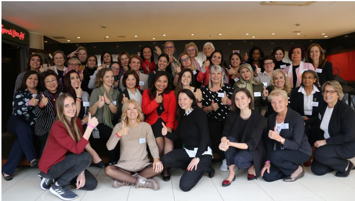
Forum sur le leadership au féminin dans la gymnastique

Le CIO a réalisé un sondage auprès des fédérations internationales sur l'égalité entre hommes et femmes et la FIG figure au quatrième rang en termes de représentation à la présidence des comités. C'est une percée majeure que je tiens à souligner. L'égalité hommes-femmes est non seulement un devoir mais une nécessité. En tant qu'organisation, nous ne pourrons pas continuer à fonctionner dans les prochaines années si nous ne respectons pas la parité des genres. Dans la foulée du Conseil, la FIG a organisé un premier Forum sur le leadership au féminin dans la gymnastique, qui a rassemblé quarante femmes de tous les continents et aux parcours différents. Les retours que nous avons eus sont excellents et j'espère que ce genre de forum donnera des idées à plusieurs.