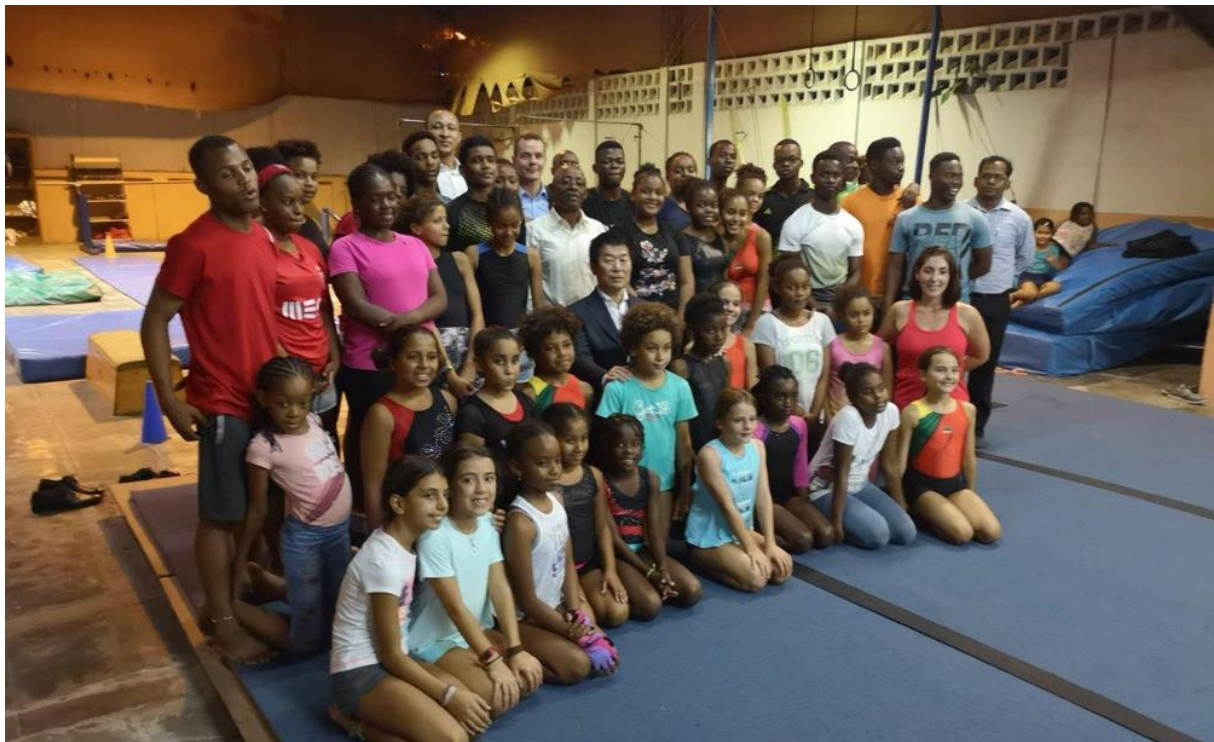
Rencontre avec des gymnastes s'entraînant à la Faculté des sports de Maputo, au Mozambique