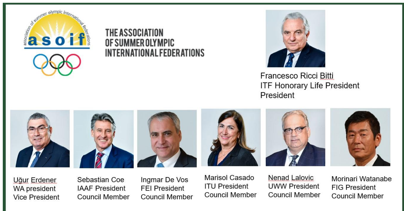
Composición del Consejo de la ASOIF

Esta posición en el Consejo de la ASOIF refleja un fuerte reconocimiento de esta perspectiva de desarrollo. Por eso quiero celebrar este honor con la familia de la gimnasia de todo el mundo.