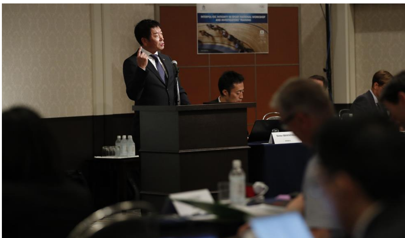
Foro sobre la integridad en el deporte en Tokio

¿Por qué confiar en mí para la gestión del boxeo? Porque el mundo del deporte entiende que la FIG ha hecho las reformas necesarias para asegurar juicios justos y honestos en gimnasia.