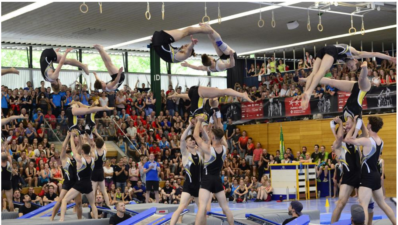
Festival Federal de Gimnasia en Aarau (Suiza)